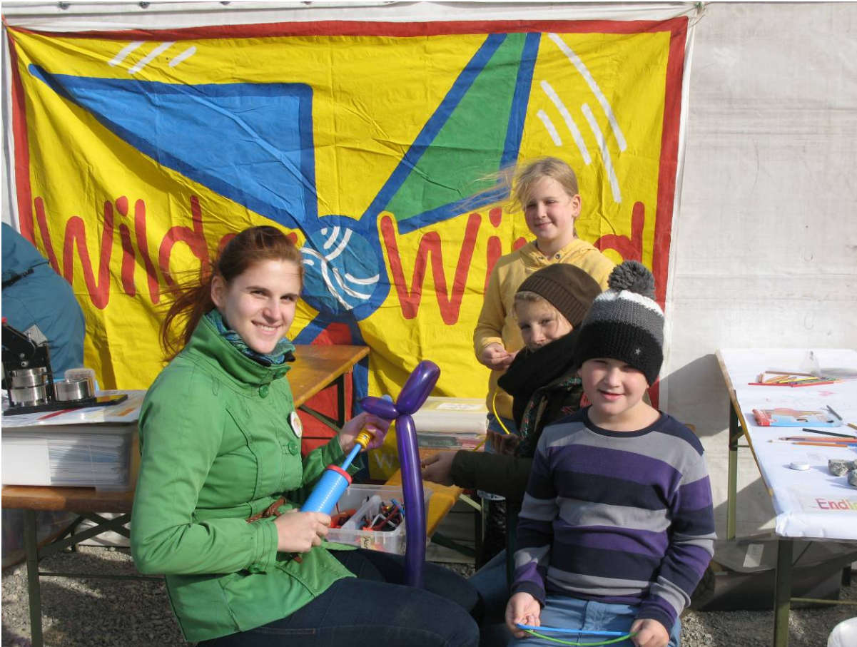
Kinderprogramm „Wilder Wind“ der IG Windkraft