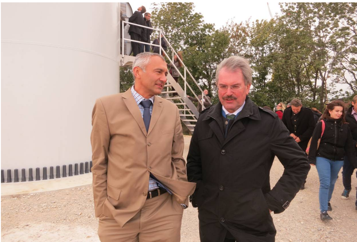
Neben dem Windrad nach der Eröffnung: