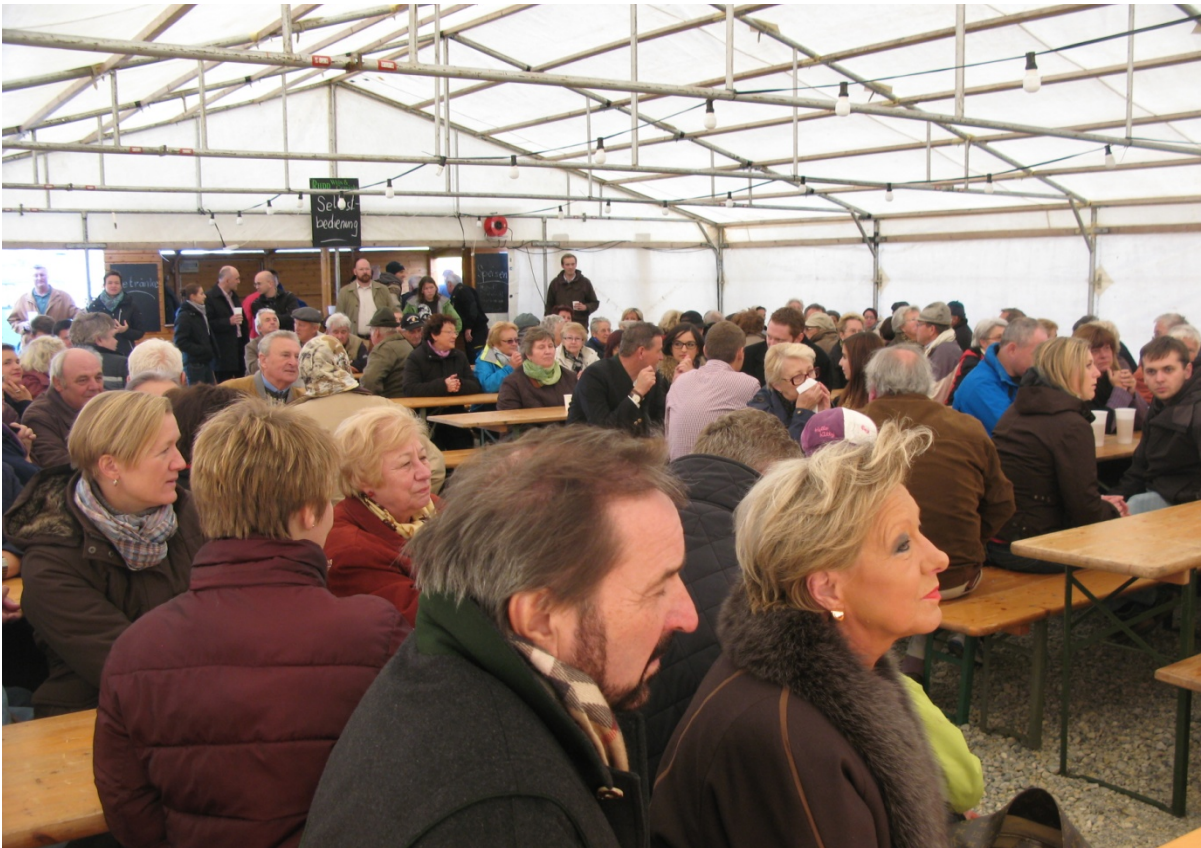
Blick in das Festzelt